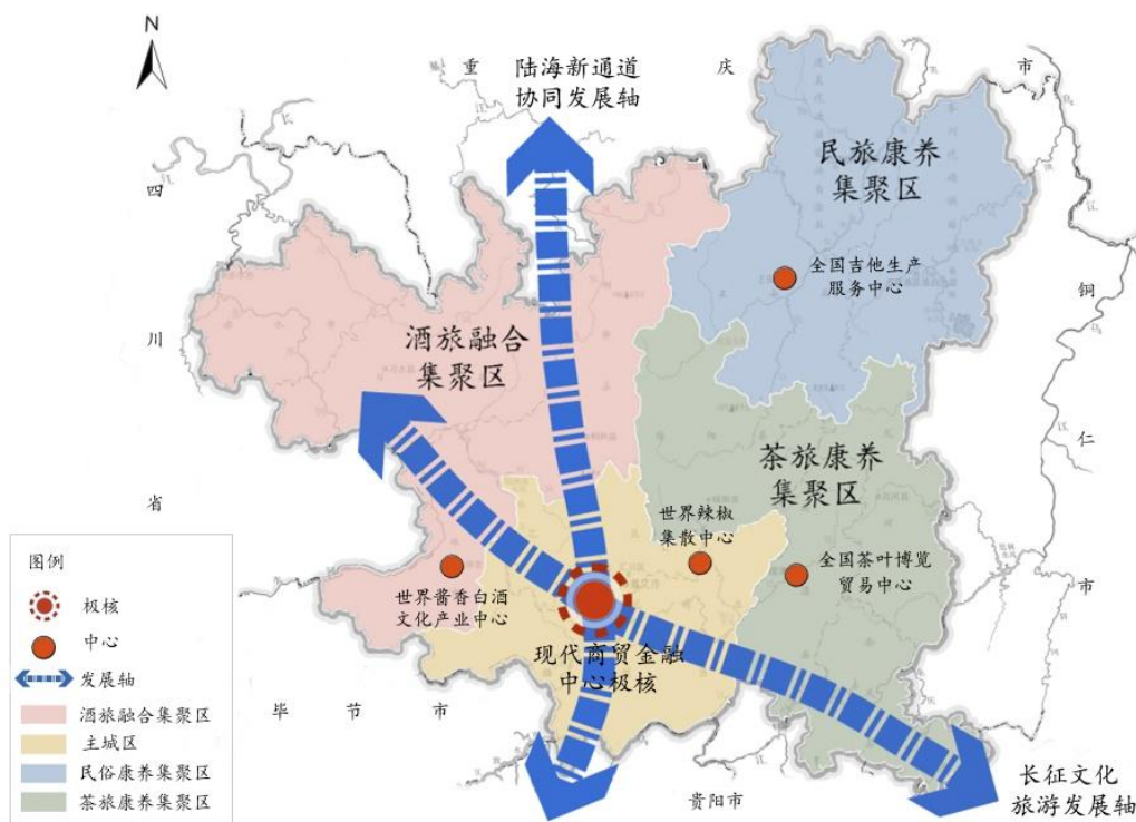
图2 遵义市服务业空间布局

化遗址为基础的长征文化旅游发展轴；“三区”是指赤水市、习水县、仁怀市、桐梓县方向的酒旅融合集聚区，湄潭县、凤冈县、余庆县、绥阳县方向的茶旅康养集聚区和务川县、道真县、正安县方向的民族康养集聚区。